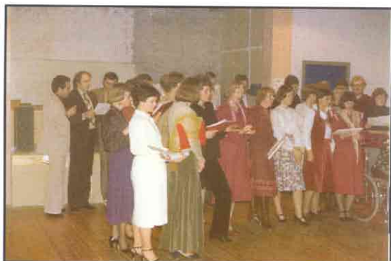
Korets 5 års fødselsdag fejres i Beboerhuset

Tak til AAEN Consulting for tryk af festskrift, til CO:PS Reklamebureau for trykning af plakater, og til Alice Kops for design af jubilæumsplakaten.